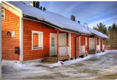
Гостиница (гостевой дом) с функциями объекта размещения и современного бизнес-центра