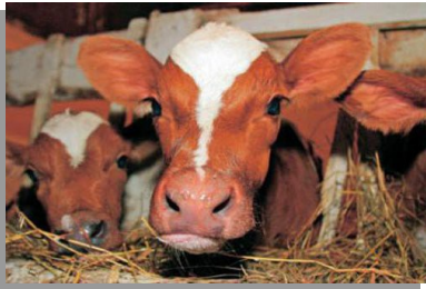
Фермерский комплекс с функциями разведения крупного рогатого скота и птицеводства